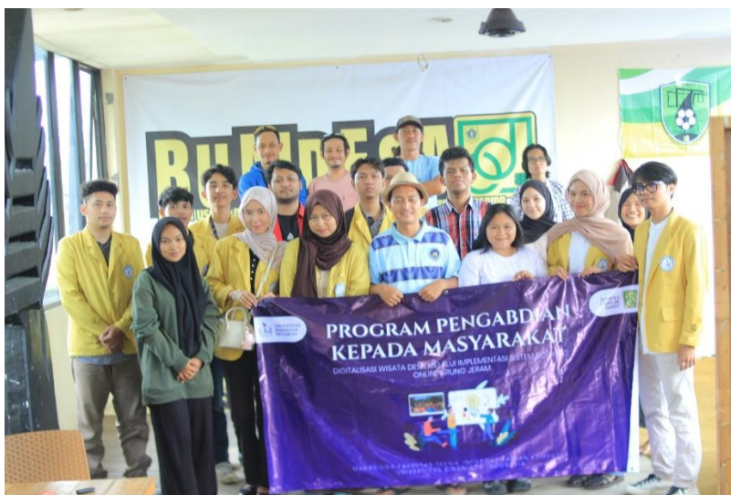
Gambar 3. Foto Bersama dengan staff BUMDes