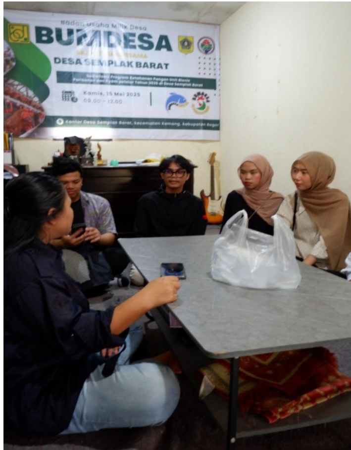
Gambar 1. Diskusi Proses Bisnis Sistem